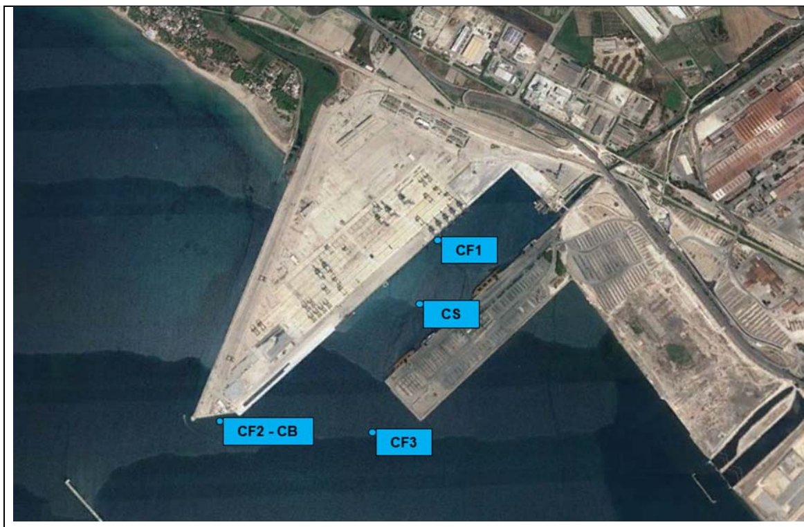
Figura 2.1 Localizzazione delle stazioni di misura/punti di campionamento per il monitoraggio del comparto idrico nella fase post-operam.