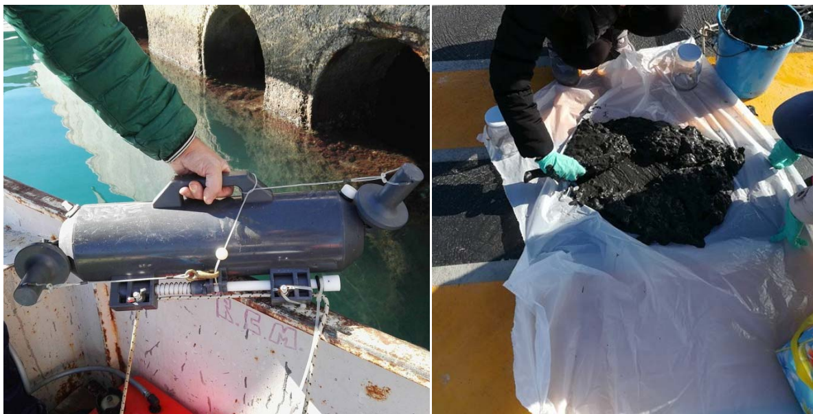
Figura 3.1 Campagna di prelievo di campioni del 29/01/2018

Uno stralcio della documentazione fotografica redatta a corredo delle operazioni di campionamento effettuate in data 29/01/2018 è riportato in Figura 3.1.